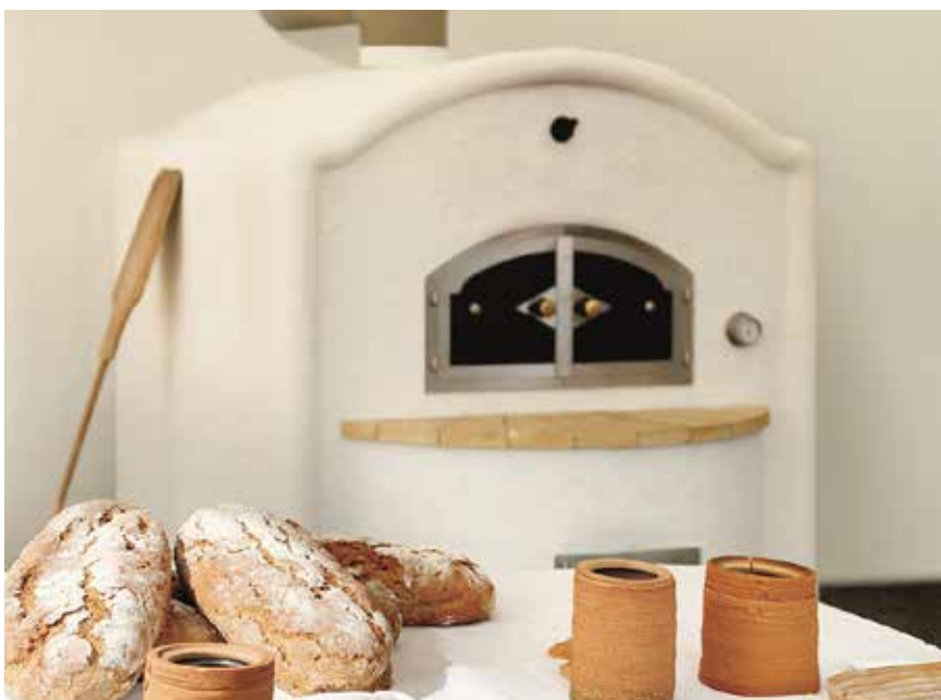
Szamotowy piec chlebowy

wieczory, tworząc miejsce spotkań rodzinnych. Wykorzystując nowoczesne piece kaflowe-szamotowe (Kachel-Grundöfen) oszczędzamy energię, budujemy ciepło rodzinnego domu oraz dbamy o środowisko, ponieważ piece te są CO 2 -neutralne.