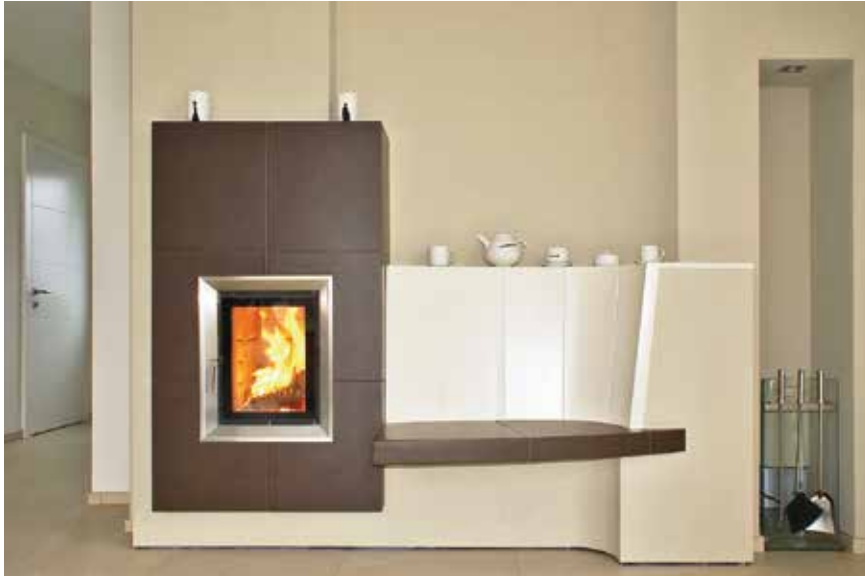
Ogrzewanie całego domu i przyjemne ciepło w harmonii z naturą